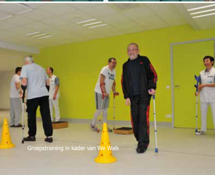
Groepstraining in kader van We Walk