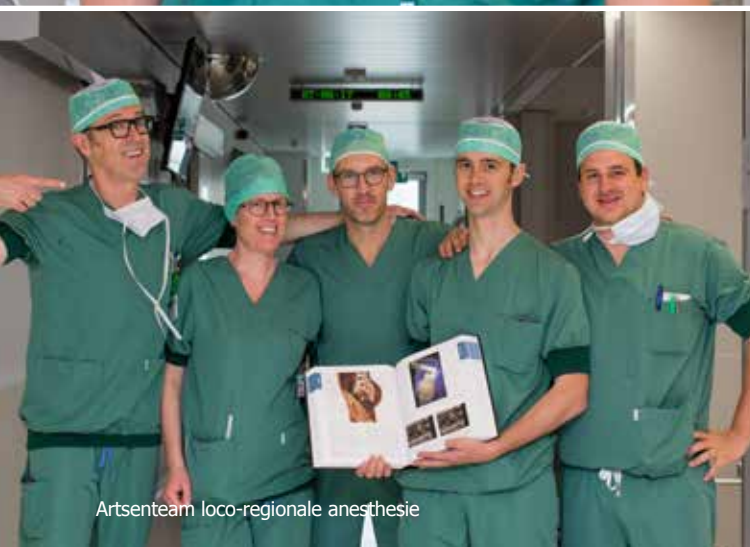
Artsenteam loco-regionale anesthesie